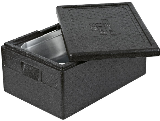
Thermobox für den Transport