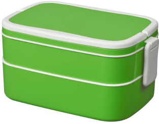
IKEA FLOTTIG Lunchbox (4,99)